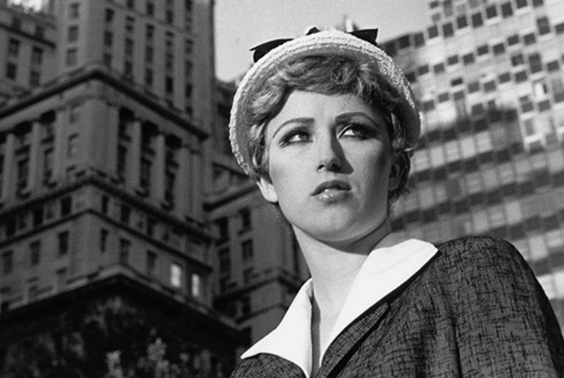
Cindy Sherman, Untitled Film Still #14 , 1978