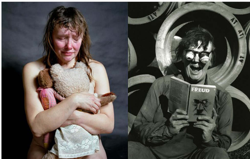
Jo Spence, Expunged , 1990, and Remodelling Photo History , 1982