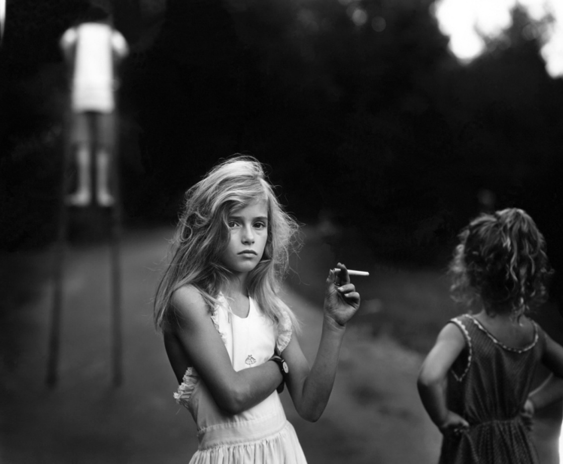
Sally Mann , Candy cigarette , cyklus Immediate Family